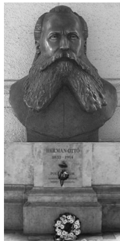
Herman Ottó szobra az Agrárminisztérium árkádjá alatt Alkotója Györfi Sándor karcagi Kossuth-díjas szobrászművész

„Kis gimnazista korom óta mesteremül vallottam Herman Ottót, akinél magyarabb, egyetemesebb érdeklődésű és hatásában maradandóbb lángelmét nem ismerek.”