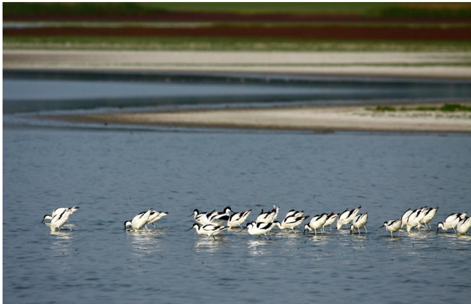
A szikes tavak egyik jellemző sziki fészkelő faja a gulipán.

megtelepedését követő időszakokhoz hasonló mennyiségben (2–4 pár) költ most a területen (Ecsedi et al., 2017).