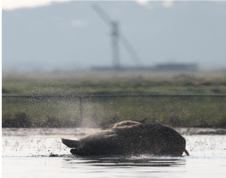
A mocsári növényzet előkezelését mangalicák végezték.