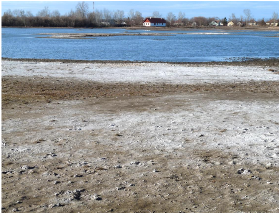
Az adaptív kezelés hatására nőtt a szódás foltok kiterjedése a Nagy-sziken.

Az ökológiai felmérések során kiderült, hogy a legtöbb szikes tó ökológiai állapota gyorsan és folyamatosan romlik (Boros et al., 2013). A fokozódó emberi tevékenységek károsító hatása miatt az általában használt konzerváció már nem elegendő védelmi intézkedés, ezért meg kell indítani a legfontosabb természetes és rontott állapotú szikes tavak adaptív kezelését és rehabilitációját az összes veszélyeztető tényező megszüntetésével. Ezután a természetre kell bízni a gyógyulásukat.