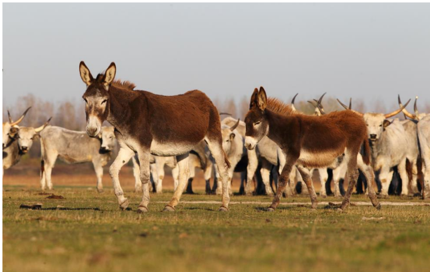
A legeltetési kezelés alapja a vegyesen tartott háziállatok és az ökológiailag fenntartható szintű legeltetés.