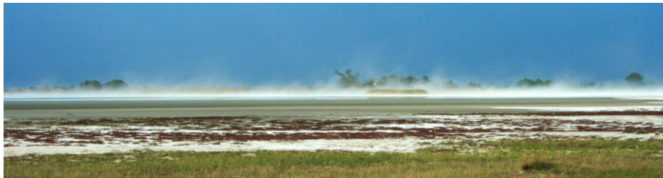
A defláció fontos fenntartó erő a szikes tavak életében.

tétes partvonalból, így a tó medre folyamatosan vándorol, ami egy szükséges és természetes folyamat. 4) Fontos a szikes tavak fizikai medrében és a közvetlen vízgyűjtő területükön a felszíni csapadékvízből és a felszín alatti szikes vizek feltöréséből táplálkozó pangó vizek jelenléte, amit mesterséges árasztásokkal tilos utánapótolni. 5) Szintén fenntartó erő a defláció, ami a felhalmozódó szerves törmelék folyamatos eltávolítását végzi, így a szélnek akadálytalanul kell áramlani a mederben és a közvetlen vízgyűjtő területeken, ellenkező esetben a szikes tavaknál káros feltöltődés érvényesül. 6) A szikes tavaknak és közvetlen vízgyűjtő területüknek kezdeti szukcessziós állapotba kell kerülniük minden évben (Ecsedi et al., 2014).