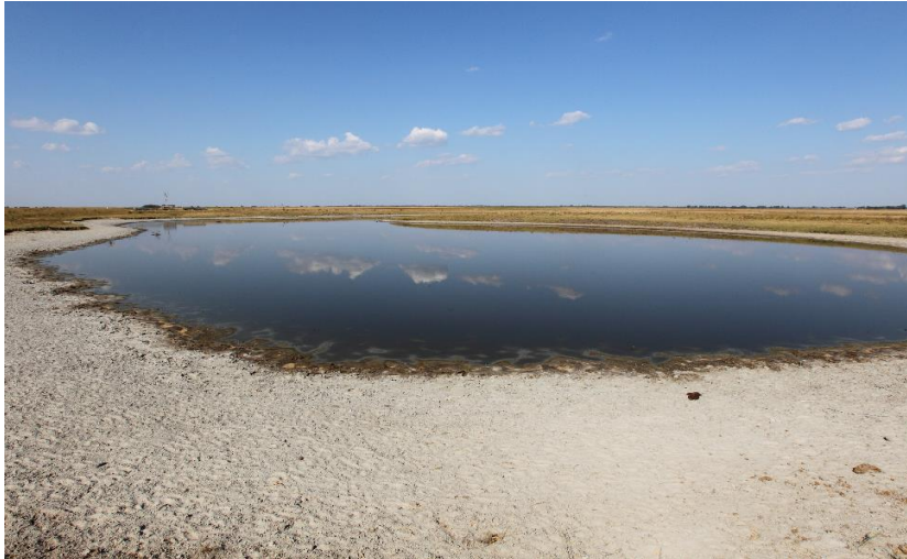
Természetes (referencia) állapotban levő szikes tó a Fertőzugban (Seewinkel).

len megmaradt képviselői. 10) Szikes tavak az Európai Unióban csak a Kárpát-medencében (Magyarország, Ausztria, Szerbia) fordulnak elő.