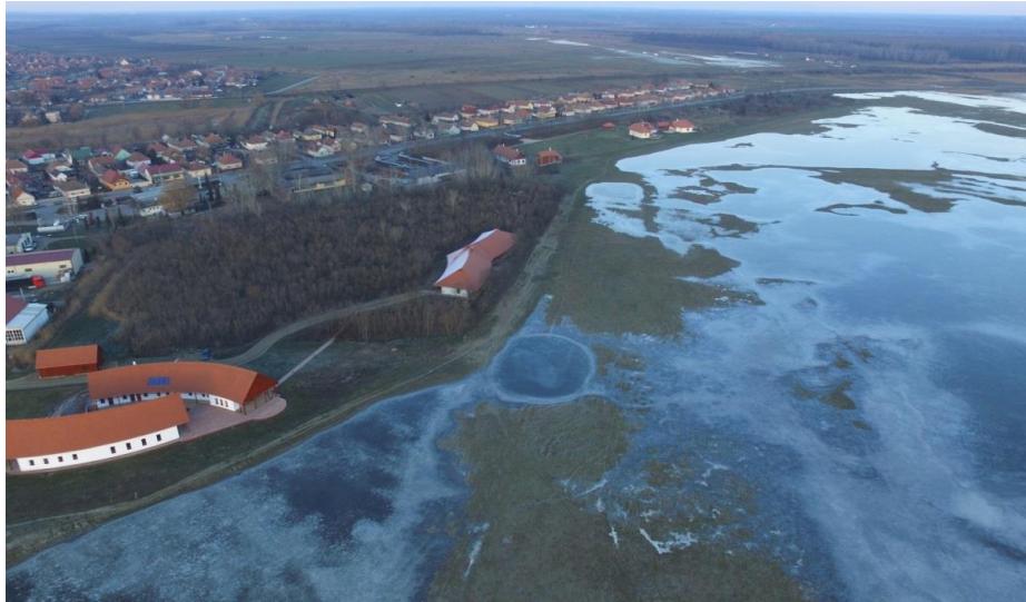
A rehabilitált Nagy-szik szomszédságában épült ökoturisztikai beruházás, a Bibic Öko-fogadó épületei.

5) A szikes tó a csapadékvíz nyár végéig tartó megőrzésével csökkenti a környék aszályos jellegét és szabályozza a helyi mikroklímát, amivel kis mértékben hozzájárul a klímaváltozás hatásainak enyhítéséhez. 6) A terület szomszédságában élők egészségének megőrzésében is szerepet vállal, hiszen a paradús, sókristályokban gazdag levegő sokat segít a légúti betegségek (pl. asztma) megelőzésében és gyógyításában. 7) Környezetpusztító világunkban felértékelődött a tájképi érték, a látványos, élhető környezetben való élet, amihez a rehabilitált Nagy-szik kedvező feltételeket biztosít. 8) A természetkedvelő lakosság kötődik a Nagy-szikhez, sokan hosszú távon szeretnének itt élni, és több új család is ideköltözött a szikes tavak lenyűgöző élővilága miatt 9) Az élőhely fejleszti a hét emberi intelligenciatípus közül a természetit, ami a táj hosszú távú megőrzése szempontjából fontos. 10) A rehabilitáció modellértékű a Kárpát-medencében, ahol a publikált eredmények felhasználásával például a Böddi-széken és a Kardoskút melletti Fehér-tavon már elindultak a rehabilitációs munkák.