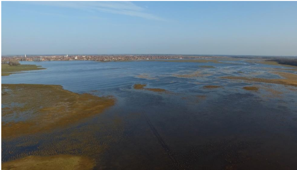
A balmazújvárosi Nagy-szik nagy vizes állapotban 2018 tavaszán

4) El kell kezdeni terjeszteni a biodiverzitás-csökkenés beárazásának eszméjét a környezeti reklámok segítségével is.