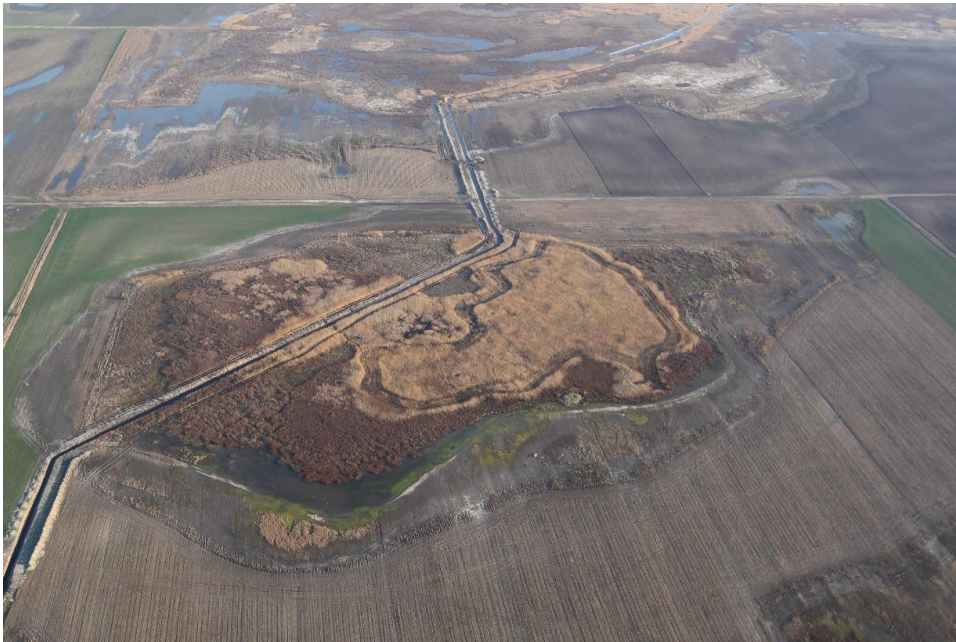
Lecsapoló csatornával tönkretett szikes tavak a Kiskunságban.

tárgyak épültek, hogy a csapadékvíz és a pangó vizek a területen maradjanak, legalább a nyári időszakig (Boros et al., 2013).