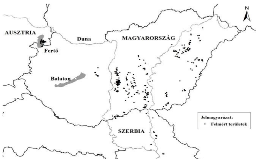
1. ábra. A 2009–2010-ben felmért szikes tavak helyzete a Kárpát-medencében (Boros et al., 2013).

Az alaptípusú ( \text{Na-HCO}_3 , \text{Na-HCO}_3 + \text{CO}_3 iondominanciájú) szikes tavak közül legtöbb és legnagyobb sűrűséggel a Kárpát-medencében fordul elő (Boros & Kolpakova, 2018), ahol egy 2009–2010-ben született átfogó felmérés során 77 természetes (referencia) és kb. 150 rontott állapotú szikes tó került elő. Helyeztük az 1. ábra mutatja be (Boros et al., 2013).