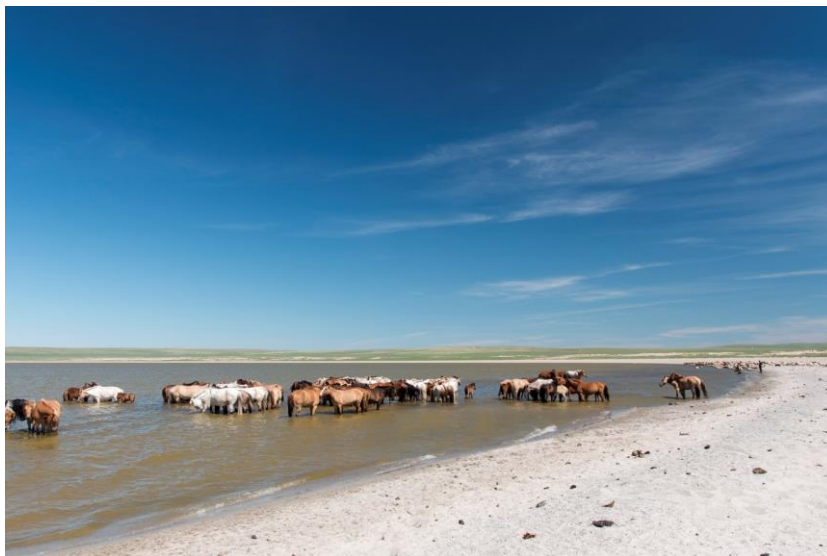
Természetes állapotú szikes tó Kelet-Mongóliában.

Szórványosan előfordulnak Észak- és Dél-Amerikában, Afrikában, valamint foltszerűen Eurázsia száraz sztyepp övezetében, de főleg a Kárpát-medencében, Törökországban, Nyugat-Kazahsztánban, Oroszországban, Mongóliában és Kínában (Boros et al., 2016). Az egyik legújabb kutatás során az eurázsiai sztyepp övezetben található 220 darab 'sós' tó irodalomból és recens gyűjtésből származó vízkémiai adatát vizsgálták felül, amiből 123 szikes tavat azonosítottak (Boros & Kolpakova, 2018).